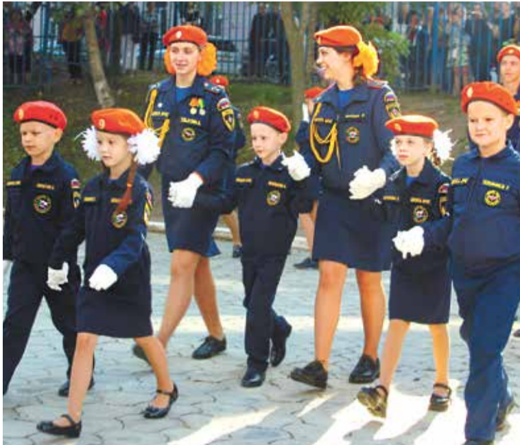
Пополнение в рядах екатеринбургских кадетов

Чрезвычайное ведомство принимает самое активное участие в образовании молодого поколения