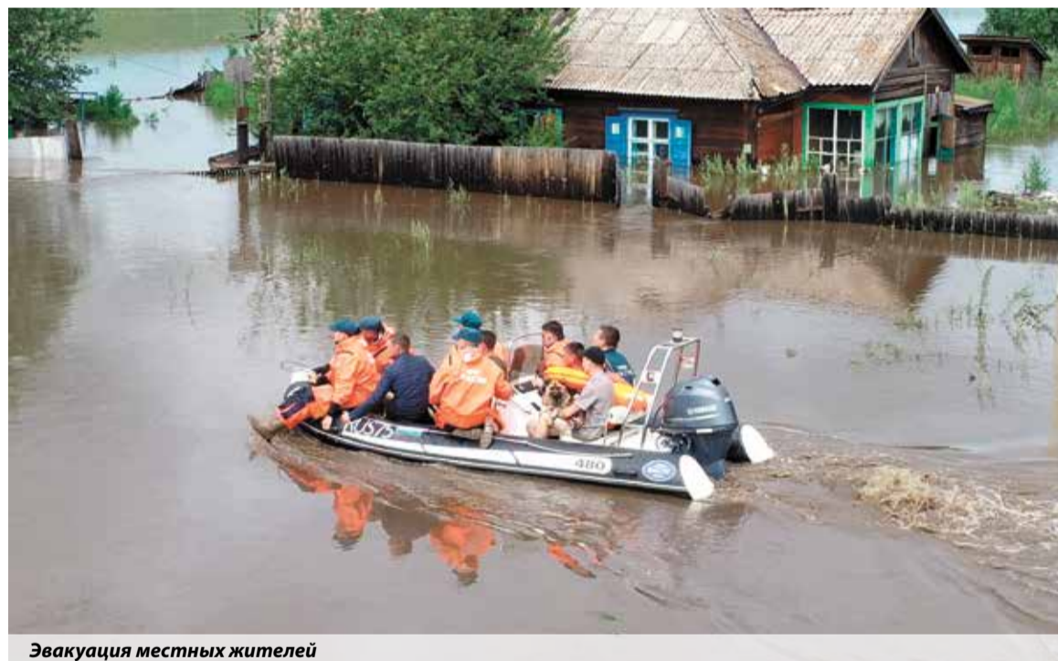
Эвакуация местных жителей

зована эвакуация населения. Людей вывозили на лодках, автоцистернах, автомобилях повышенной проходимости. В селе Шелопугино жителей пришлось эвакуировать уже с крыш домов — настолько высоко поднялась вода. Благодаря слаженным действиям сотрудников МЧС удалось предотвратить человеческие жертвы.