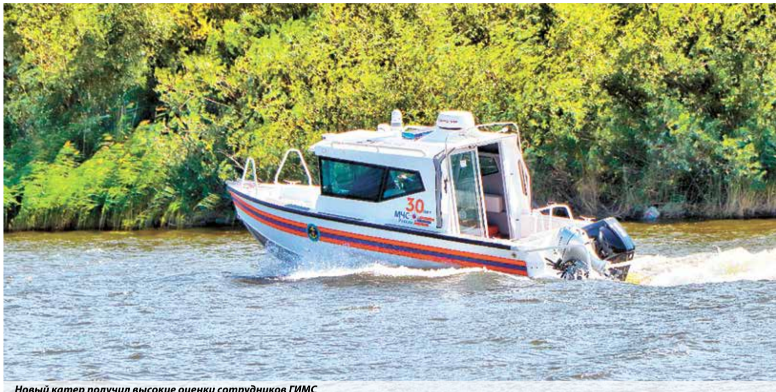
Новый катер получил высокие оценки сотрудников ГИМС

— Сотрудники МЧС России обеспечивают безопасность граждан на водных объектах региона в самых разных погодных условиях и в разное время суток. Эта модель позволяет осуществлять патрулирование при температуре воздуха от -5^{\circ}\text{C} до +35^{\circ}\text{C} и температуре воды от 0^{\circ}\text{C} до +35^{\circ}\text{C} , при этом внутри салона созданы комфортные условия для личного состава, позволяющие качественно выполнять задачи по назначению.