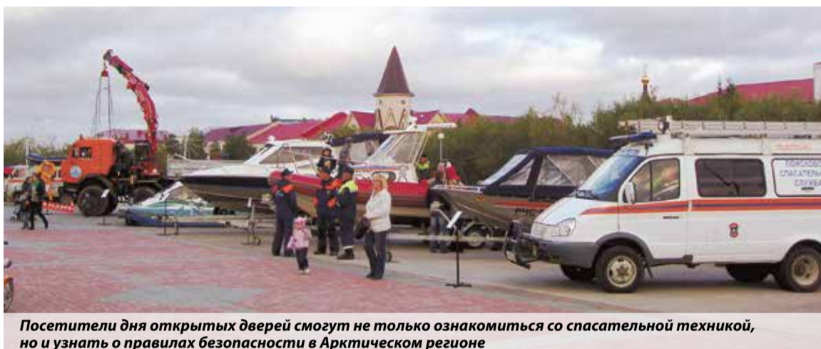
Посетители дня открытых дверей смогут не только ознакомиться со спасательной техникой, но и узнать о правилах безопасности в Арктическом регионе

Место проведения — Воркута. В рамках мероприятия сотрудники Интинского филиала Центра ГИМС и общественники ВОСВОД проведут занятия со школьниками и студентами. В качестве помощников будут привлечены сотрудники коми-