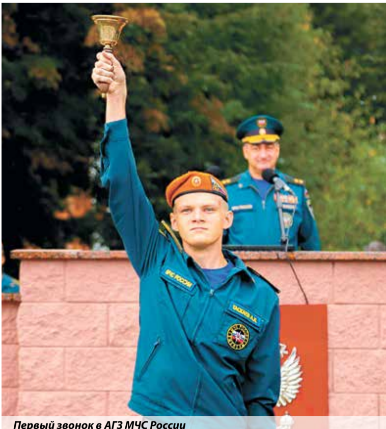
Первый звонок в АГЗ МЧС России