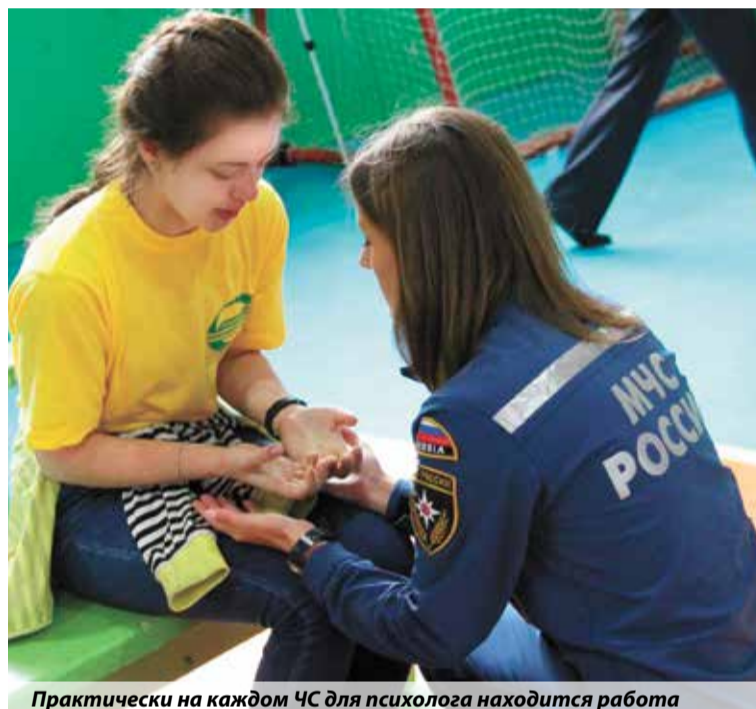
Практически на каждом ЧС для психолога находится работа

не хотела разговаривать. У нее погиб старший сын и остались еще двое детей на руках. Женщина избегала общения при личной встрече, не отвечала на звонки. Однако написала мне сообщение. У нее была потребность выговориться, но реализовала она ее именно таким образом — видимо, единственным возможным для себя в той ситуации способом контакта. Для меня это было