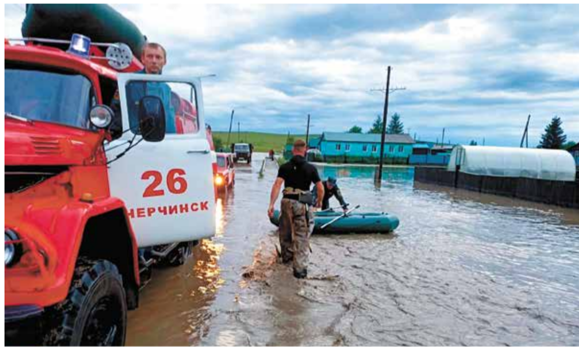
А вода по асфальту рекой

Артем Кондратьев, пресс-служба ГУ МЧС России по Забайкальскому краю