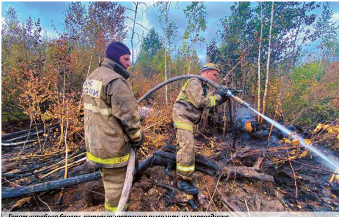
Горят штабеля бревен, которые запрещено вывозить из заповедника

Риск попасть в такие условия есть практически всегда. Очень много в подобных ситуациях зависит от того, как управлять силами и средствами. Если избегать суматохи и паники, всегда можно продумать пути отхода. И они должны быть у каждого участника тушения