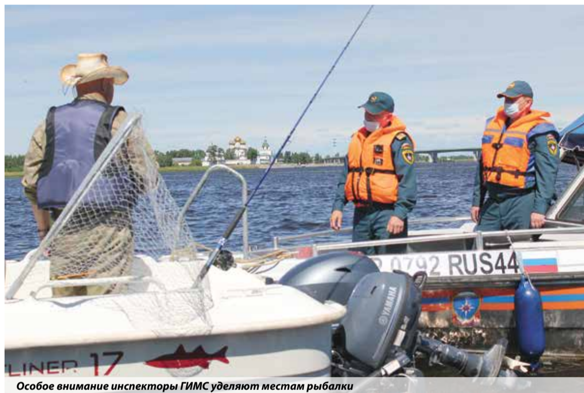
Особое внимание инспекторы ГИМС уделяют местам рыбалки

патрулирование акватории. Костромичи адекватно реагируют на замечания, охотно идут на контакт во время инструкторажей.