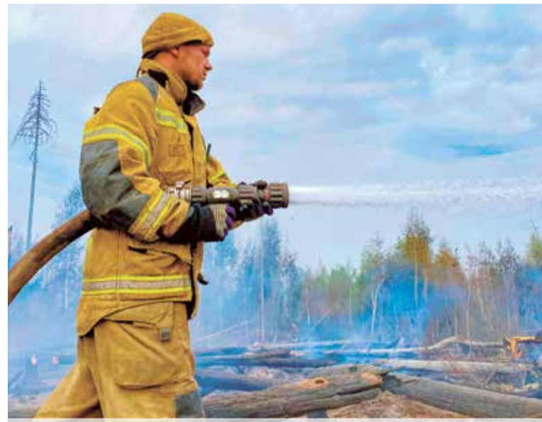
Каждый участник тушения заслуживает благодарности и наград

— В Мордовии есть предприятие, которое наладило выпуск спецавтомобилей. Это фактически передвижной пожарный водоем — 20 кубов с одной заправки. Для сель-